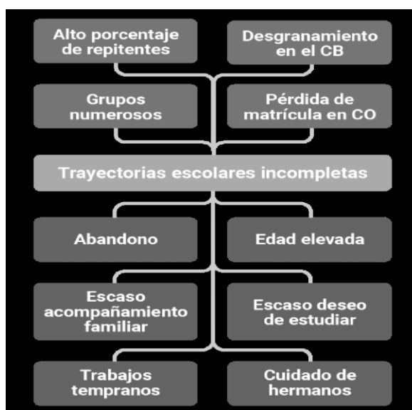
Figura 3: Árbol de problemas

También manifiesta acciones que se pretenden realizar, por los directivos de la institución como: localizar a los alumnos, para acercarlos a la escuela, evitando así la repitencia, implementando acciones junto al Ministerio de Trabajo. Además trabajar las trayectorias escolares en conjunto con el coordinador de curso, los profesores tutores y docentes de aula, evaluando de forma periódica.