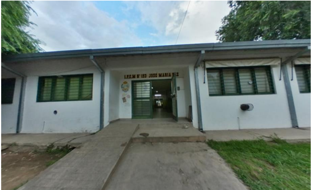
Imagen 1. I.P.E.M N° 193 José María Paz