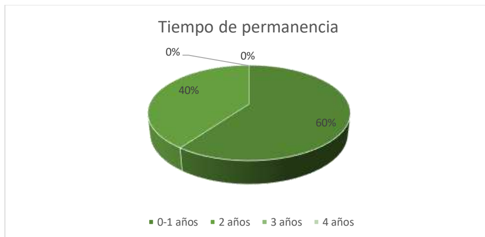
Gráfico 5. Tiempo de permanencia de la empresa ante falta de financiamiento.