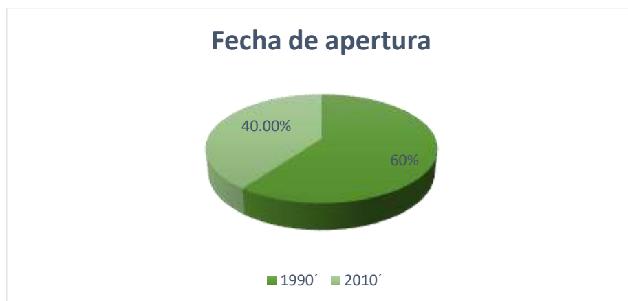
Gráfico 3. Fecha de apertura de las empresas.

El inicio de 3 empresas (las 2 productoras lácteas y 1 de producción de golosinas) vieron su apertura en 2012, mientras que las otras 2 empresas restantes, se dedicaban a su producción desde la década del 90', como se indica en el gráfico 3.