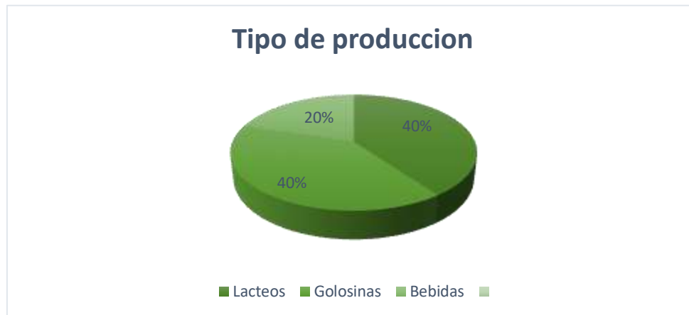
Gráfico 2. Tipo de producción de las empresas.