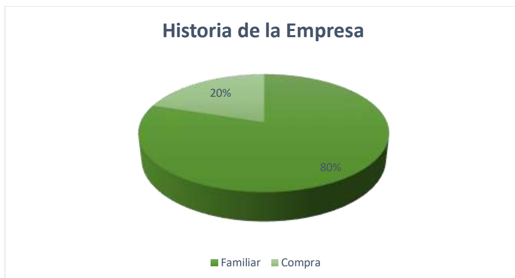
Gráfico 1: Historia de la empresa.

Las empresas seleccionadas, sostienen una historia y contexto semejante entre sí: 4 de las empresas elegidas poseen un inicio del emprendimiento de carácter hereditario familiar, mientras que solo 1 empresa se ha originado por la compra de galpón e infraestructura. Estos datos se indican en el gráfico 1. Ninguna de las empresas analizadas se encuentra actualmente en actividad.