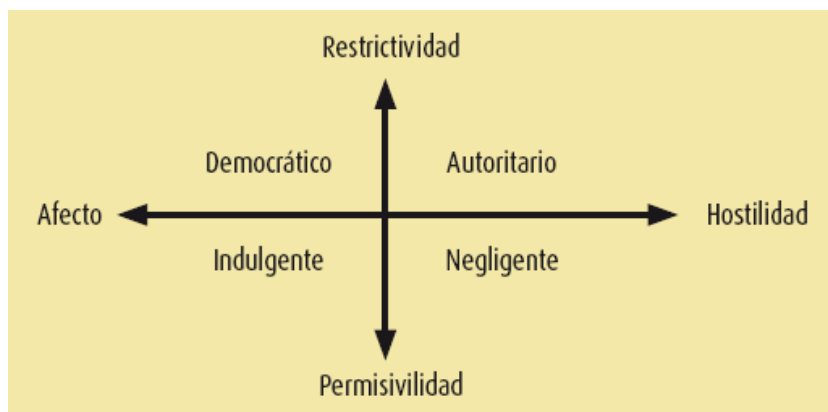
Figura 1: Estilos educativos