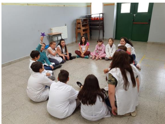
Fotos tomadas a los niños durante la mencionada actividad

De lo anterior se desprende la importancia de este tipo de actividades dentro del ambiente áulico, no sólo en lo emergente sino como acciones programadas, las cuales producen un impacto diferente en los alumnos. De ahí es que se sugiere la implementación de un proyecto que contemple actividades con formato taller, que salgan de lo normal del trabajo de clase pero con una planificación adecuada que permita ser evaluada, reajustada y mejorada durante el propio trayecto.