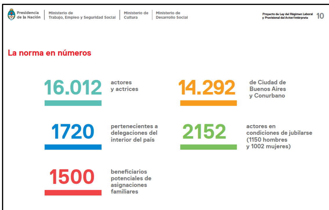
Gráfico 1: Sujetos beneficiarios del régimen laboral y previsional del actor-intérprete