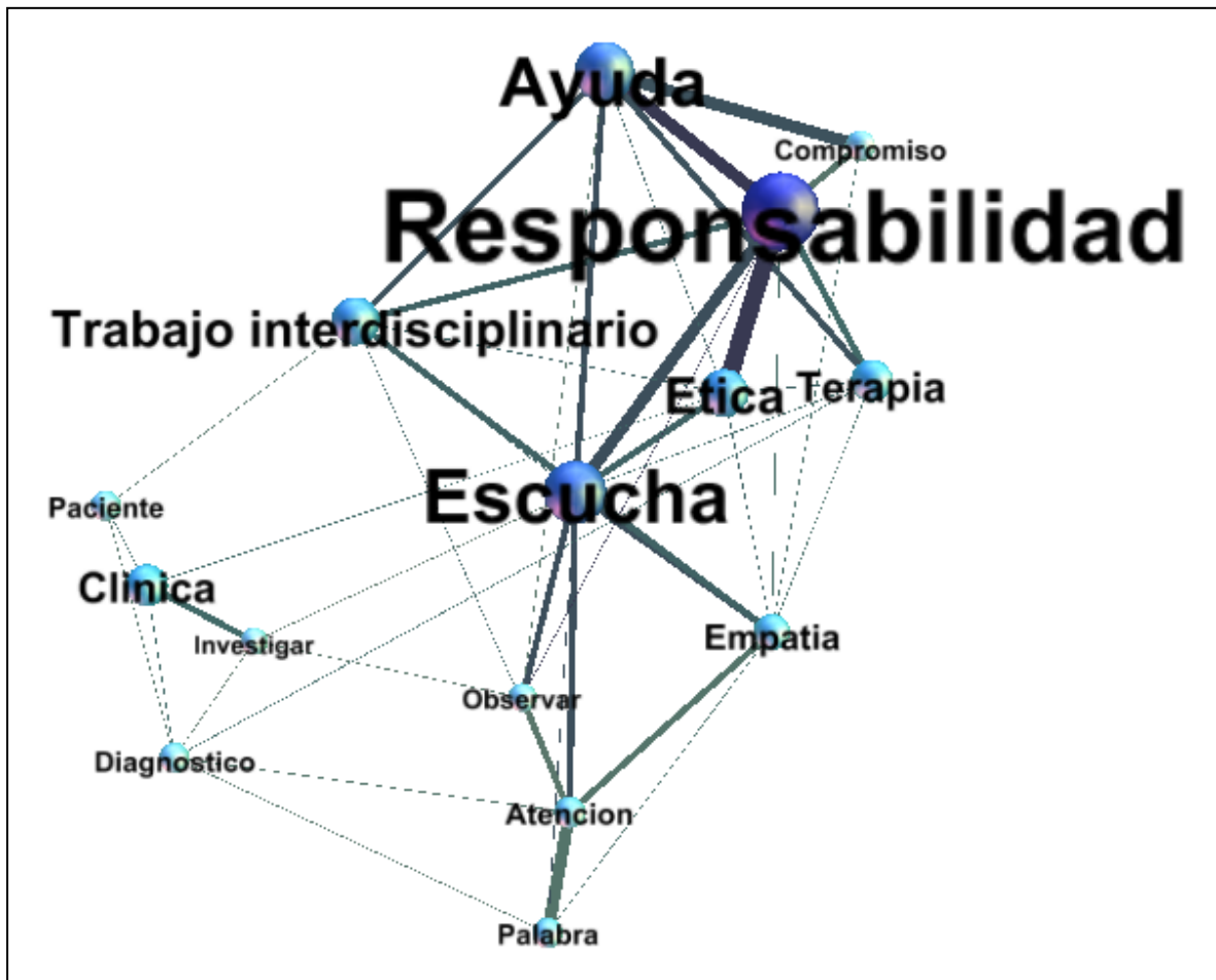
Figura3. El tamaño de los nodos y las etiquetas, así como la intensidad del color, dan cuenta del nivel de centralidad. El tamaño aumentado del nodo y las etiquetas, como la mayor intensidad del color, dan cuenta de una importancia más fuerte en las definidoras correspondientes. Asimismo, el grosor de las aristas (conectores) informa de una mayor interrelación entre los nodos.