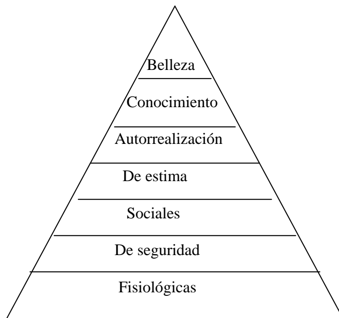
Pirámide de necesidades de Maslow adaptada. (Braidot, 2005:141)

Por otro lado, se agrega a las necesidades de conocimiento, ya que los avances tecnológicos permitieron que muchas de las actividades realizadas normalmente por el hombre se conviertan en mecanizadas. Esto produjo un aumento en la importancia de la preparación intelectual de las personas, quienes pasaron a ser el activo clave de las empresas.