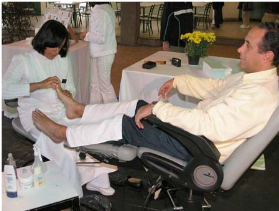
Imagen presentada en la entrevista