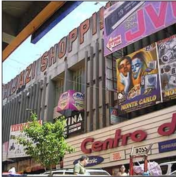
Centro comercial en Ciudad del Este