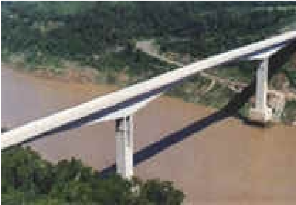
Puente Internacional Tancredo Neves- Puerto Iguazú/Foz Iguazú