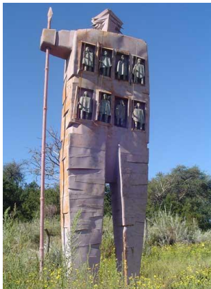
Monumento a la cultura Ranquel, Paraje Leuvucó