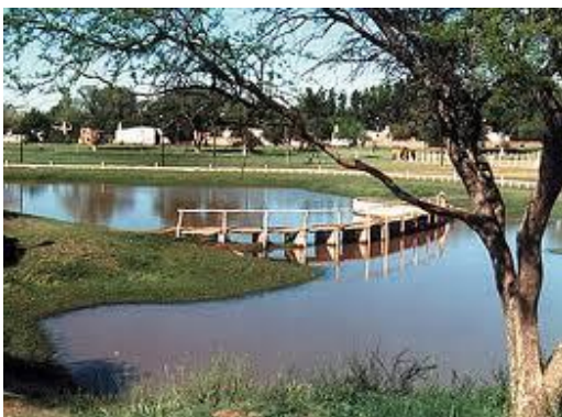
Parque Los Pisaderos. Localidad de Victorica