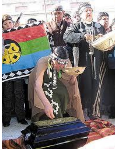
Ceremonia traslado de los restos mortales del Cacique Gregorio Yancamil