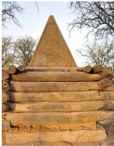
Tumba en forma de pirámide ubicada en Leuvucó donde yacen los restos del Cacique Mariano Rosas