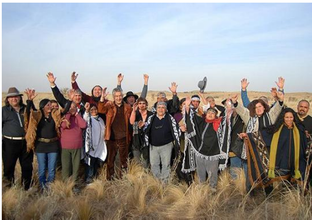
Ceremonia Organización Religiosa “Pillenu Rankül”