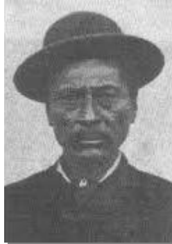
Cacique Mariano Rosas

al pueblo Ranquel mediante el traslado de los restos mortales del cacique Mariano Rosas.